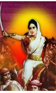
समस्या व प्रश्नाबाबत जाणीव व संवेदनशीलता असावी, सामाजिक क्षेत्रात सक्रिय सहभाग असावा, महिला अत्याचारांमध्ये समाविष्ट नसावी, बालविवाह प्रतिबंध, हुंडा निर्मूलन, लिंग चिकित्सा प्रतिबंध, घरगुती हिंसा प्रतिबंध, महिला सक्षमीकरण, महिला स्वयंसहायता बचत गट, आरोग्य साक्षरता, मुलींच्या शिक्षणासाठी पुढाकार