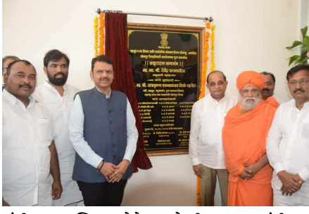
उपस्थित होते. यावेळी उपमुख्यमंत्री देवेन्द्र फडणवीस यांनी जिल्हाधिकारी कार्यालयाच्या नवीन इमारतीसाठी जिल्हा प्रशासनास शुभेच्छा देऊन अभिनंदन केले. या इमारतीची उपमुख्यमंत्री श्री.

पार्किंगव्यतिरीक्त दोन मजले आहेत. बाह्य व अंतर्गत पाणीपुरवठा, जलनिःस्सारण, विद्युतीकरण, संगणकीकरण ही कामे पूर्ण करण्यात आली आहेत. या इमारतीत जिल्हाधिकारी कार्यालयांतर्गत १९ शाखा स्थलांतरीत होणार आहेत. त्यामुळे अधिकारी-कर्मचाऱ्यांना काम करण्यासाठी पोषक वातावरण निर्माण होणार आहे. अभ्यागतांची, सर्वसामान्य नागरिकांचीही सोय होणार आहे. सोलापूर जिल्हाधिकारी कार्यालयाची जुनी इमारत १९८६ मध्ये त्यावेळच्या गरजेनुसार बांधण्यात आली होती. आता ३६ वर्षांनंतर ही इमारत अपुरी पडत होती. पार्श्वभूमिवर जिल्हाधिकारी कार्यालयास नवीन इमारत आणि नवीन चेहरा प्राप्त झाला आहे.